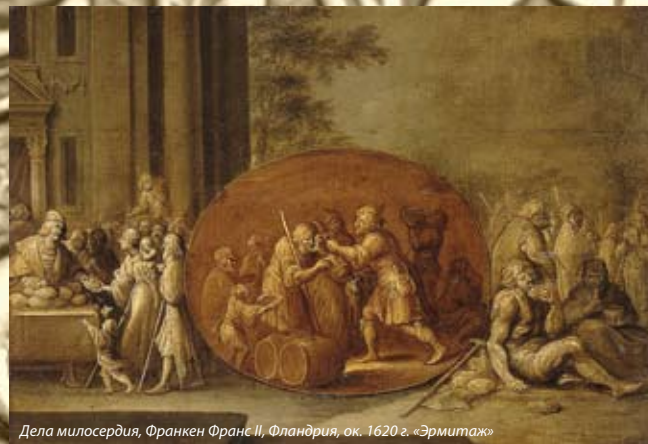
Дела милосердия, Франкен Франс II, Фландрия, ок. 1620 г. «Эрмитаж»

Когда я был подростком, заповеди блаженства не давали мне спокойно жить. Бывало, прочту какую-нибудь книгу и дам себе торжественную клятву всегда поступать так, как поступил бы Иисус на моем месте. Однажды я решил, что мою любовь к материальным вещам чрезмерна. Я отдал другу свою великолепную коллекцию из тысячи ста бейсбольных карточек, в которой было несколько редчайших экземпляров, и ждал, что получу награду свыше за такое само-