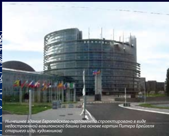
Нынешнее здание Европейского парламента спроектировано в виде недостроенной вавилонской башни (на основе картин Питера Брейгеля старшего и др. художников)

Библейское предание о вавилонской башне и смешении языков нашло свое отражение так же у микиров, одного из многочисленных тибетско-бирманских племен Ассама. Микиры рассказывают, что в «...стародавние времена... люди... вздумали завоевать небо и принялись строить