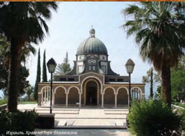
Израиль. Храм на Горе блаженств

Дорогие друзья, только что приведенный текст из Евангелия от Матфея говорит нам об исполнении пророчества Исаии, записанном в Ис.9:1-2, которое было произнесено почти за 700 лет до тех времен, когда Господь Иисус Христос совершал Свое служение в Капернауме, Кане, Вифсаиде и в других галилейских городах и селениях.