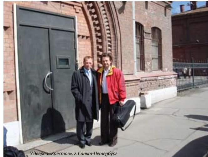
У дверей «Крестов», г. Санкт-Петербург

Я не перестаю удивляться Божьим чудесам, которые продолжают происходить на земле каждый день. Господи, помоги нам всем замечать их и прославлять Тебя за милость Твою и за чудные дела для сынов человеческих. А сколько еще таких «Викторов» все еще противятся, убегают от Христа, делая попытку за попыткой, устраивая подкопы в своих судьбах и сердцах. Куда они могут привести? И кто их там ожидает?