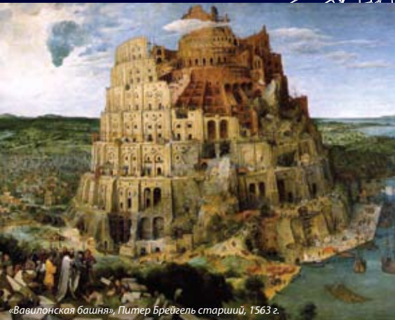
«Вавилонская башня», Питер Брейгель старший, 1563 г.

В нашей недавней истории мы помним знаменитые комсомольские стройки, помним мы и страшные стройки 30-х годов, когда камни городов и магистралей клались поверх человеческих тел — узников сталинских ГУЛАГов... Были в истории и знаменитые постройки пирамид Египта, императорского дворца в Пекине, длившиеся десятилетиями. Но главной стройкой, не имеющей себе равных в истории, было создание Вавилонской башни.