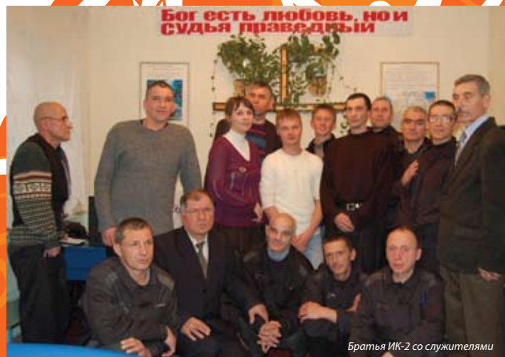
Братья ИК-2 со служителями