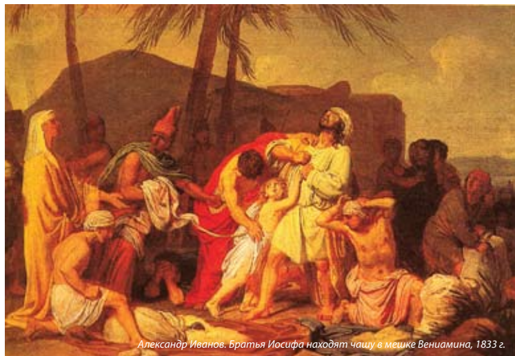
Александр Иванов. Братья Иосифа находят чашу в мешке Вениамина, 1833 г.

«Израиль любил Иосифа более всех сыновей своих, потому что он был сын старости его, — и сделал ему разноцветную одежду» (Быт.37:3). И эту любовь Иосиф возвращает своему отцу много лет спустя. Многократно в Библии повторяется, что братья Иосифа его ненавидели. Корни этой ненависти крылись в ревности.