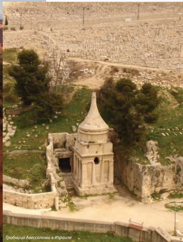
Гробница Авессалома в Израиле

Из глубины полного отчаяния сердца царя Давида я слышу эхо любви Божией: «...о, кто дал бы мне умереть вместо тебя...» Авессалом убит, уже поздно, но сердце Давида обливается кровью за мной, и он плачет: «О, если бы я мог быть на твоём месте!» Таково сердце родителя, любящего Господа, он не может быть спокойным, пока не получит удовлетворительный ответ о чаде своем: благополучен ли отрок мой? Он готов положить свою жизнь за спасение души своего сына или дочери. Апостол Павел имел такое сердце, исполненное любовью Божией. Он мог сказать: «Истину говорю во Христе, не лгу, свидетельствует мне совесть моя в Духе Святом, что великая для меня печаль и непрестанное мучение сердцу моему...» Послушайте, какие невероятные слова следуют дальше, они непонятны лишь тому, кто не имел этого крещения Божьей любовью: «...я желал бы сам быть отлученным от Христа за братьев моих, родных мне по плоти...»