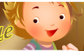
Подарки детям из детдома