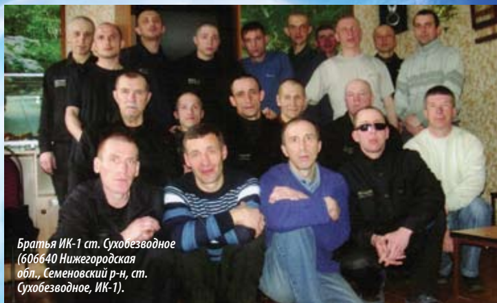
Братья ИК-1 ст. Сухобезводное (606640 Нижегородская обл., Семеновский р-н, ст. Сухобезводное, ИК-1).