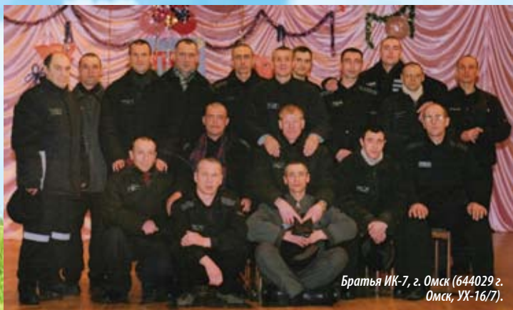
Братья ИК-7, г. Омск (644029 г. Омск, УХ-16/7).