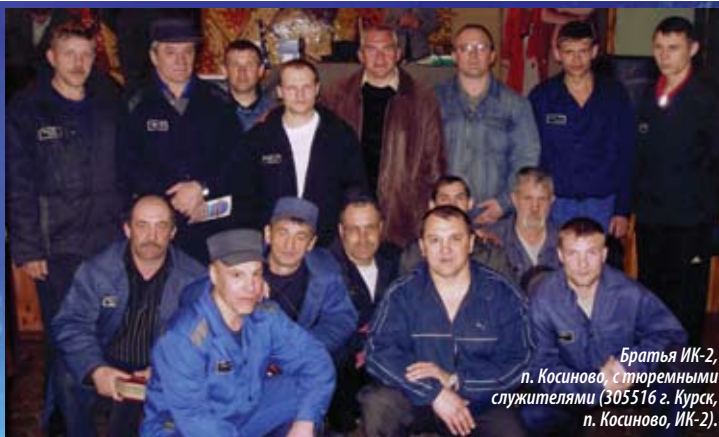
Братья ИК-2, п. Косиново, с тюремными служителями (305516 г. Курск, п. Косиново, ИК-2).