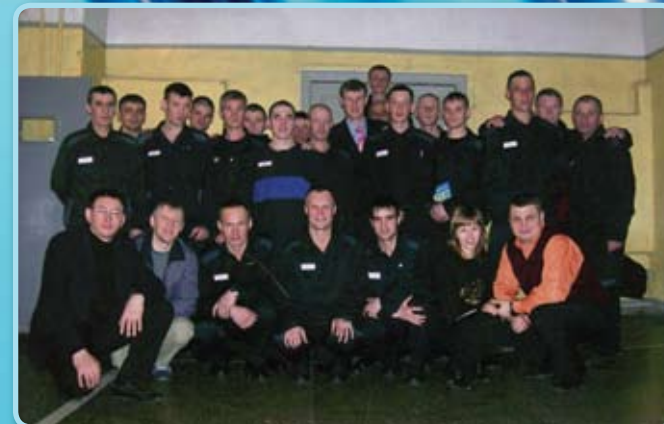
Община ИК-17 (660111 г. Красноярск, УП-288/17).