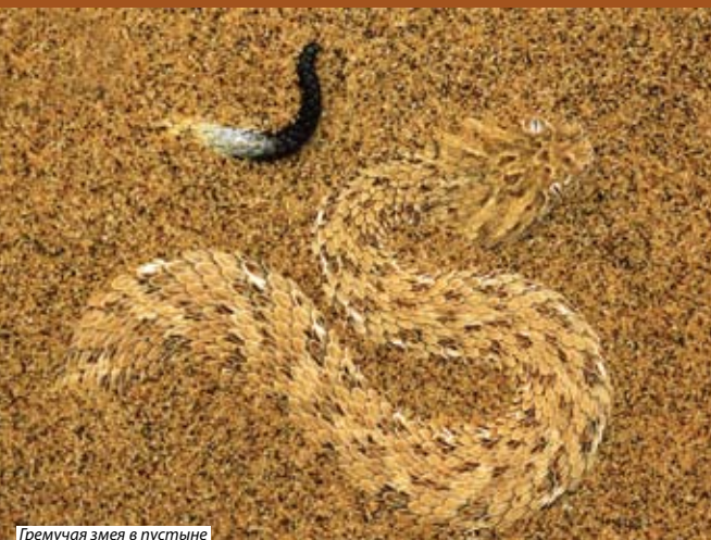
Гремучая змея в пустыне