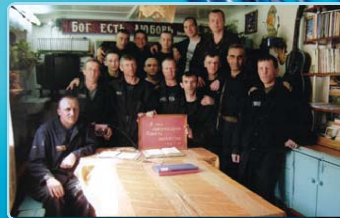
Община ИК-3 (676910 Амурская обл., Ивановский р-н, ст. Среднебелая, ИК-3).