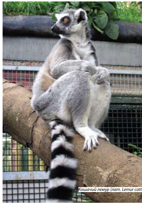
Кошачий лемур (лат. Lemur catta)

Но даже если допустить на минутку, что подобная бессмыслица имела место быть, тут же напрашивается следующий вопрос: а откуда тогда взялись сами обезьяны? Атеисты-материалисты говорят — от животных, похожих на современных лемуринов (не что среднее между лисой, кошкой и обезьяной). Да каким же образом?! А таким же, каким человек «произшел» от обезьяны: то есть фантастическим, явно нереальным, благодаря стечению тысяч невероятных чудесных обстоятельств. Простите, да почему же сегодня лемуры (обитающие в основном на острове Мадагаскар) не рожают обезьян? И почему обезьяны не рожают лемуринов (или людей)? Ну, мол, за