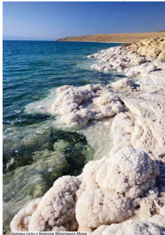
Залежи соли у берегов Мертвого моря

Что же так удерживало этого человека, что привязывало его в этом месте мерзости и разврата — кажется нам неразрешимой загадкой. И все это не так загадочно для того, кто знает, что сердце человеческое лукаво и крайне испорчено. Так что только Господь может изменить его (Иер.17:9). О, как сердце умеет лицемерно выставлять наружу отвращение ко греху, словами осуждать его, а самому представляться чистым и невинным тогда, когда оно питает, терпит и держится его! Как страшно жить там, где грех проявляет сатанинскую власть, но насколько ужаснее, когда он достигает такого господства в собственном сердце! «...отделитесь, говорит Господь, и не прикасайтесь к нечистому, и Я приму вас. И буду вам Отцом, и вы будете Моиими сынами и дочерьми, говорит Господь Вседержитель» (2 Кор.6:17-18).