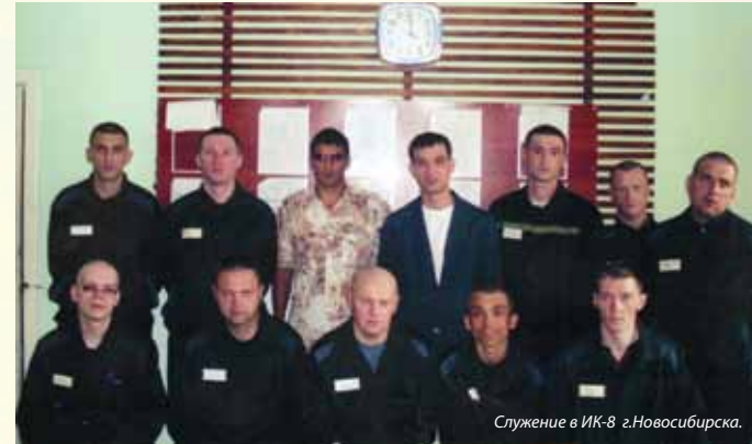
Служение в ИК-8 г.Новосибирск.

(630088 г. Новосибирск, ул. Зорге 71/44).