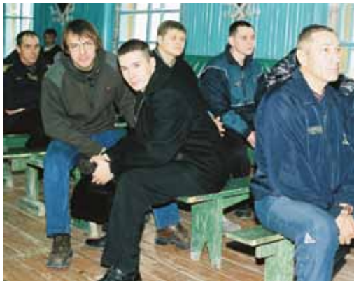
Общение в колонии