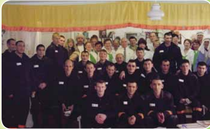
Братья ИК-34, 660119, Красноярская обл., п. Старцево, ОИК-36.