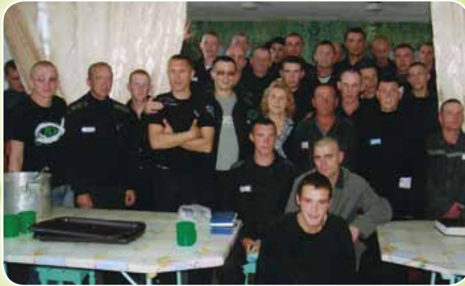
Братья ИК-4, 652971, Кемеровская область, Таштогольский р-н, п. Шерегеев.