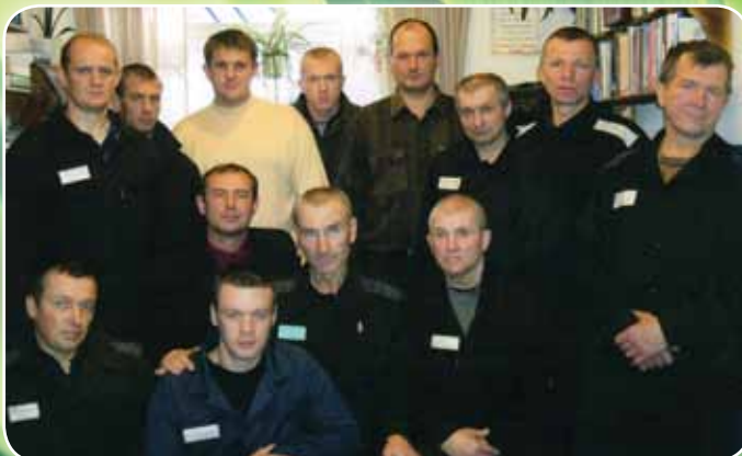
Братья ИК-4, 242300, Брянская обл., Брасовский р-н, п. Локоть.