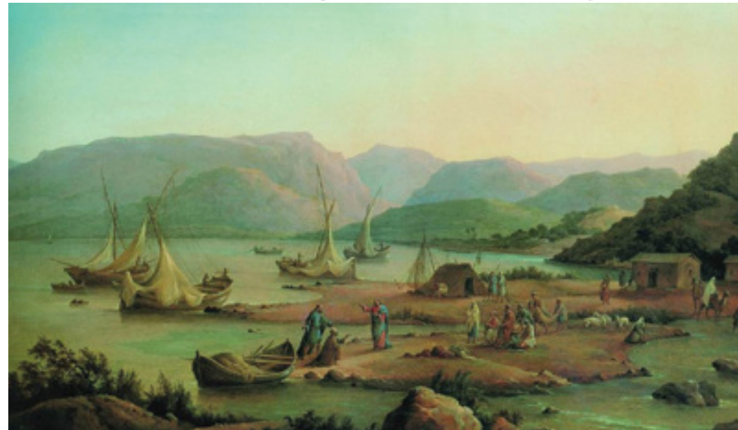
Григорий Чернецов «Призвание первых апостолов», 1866 год

Во-первых, необходимо серьезно взяться за изучение Слова Божьего. Изберите личный план изучения Библии. Может быть, вы сможете выделить для этого один вечер в неделю, или будете читать Библию и размышлять над прочитанным каждое утро. Изучая Слово