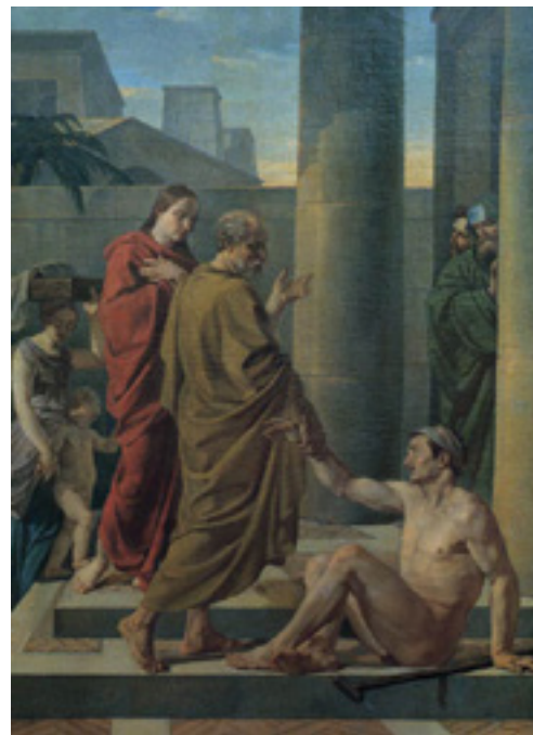
Василий Шебуев «Апостолы Петр и Иоанн исцеляют хромого», 1838 год

Четвертая характеристика ученика Христова заключается в том, что его жизнь приносит плод . Плодоносной становится и его собственная жизнь, и жизнь тех людей, с которыми он соприкасается. В Евангелии от Иоанна (15:8) сказано: «Тем прославится Отец Мой, если вы принесете много плода и будете Моими учениками». Все добрые качества и добрые