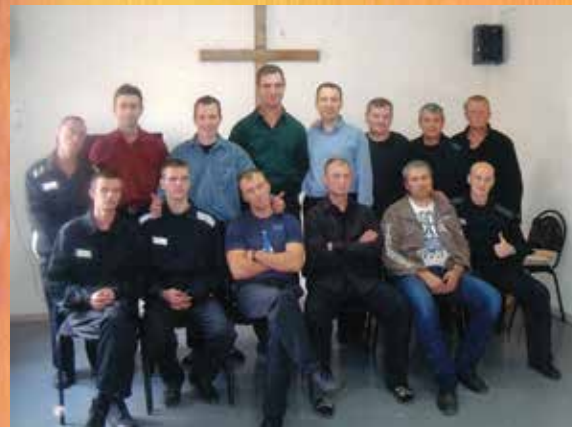
Братья ИК-12. В начале 2013 года на территории колонии открылся Дом Молитвы. Теперь верующие могут здесь собираться и славить Господа.

«Свобода! Такое громкое и многозначительное слово. Но истинного смысла, который заложен в этом слове, я никогда не мог даже и представить.