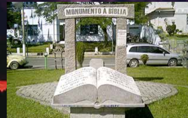
Памятник Библии в городе Витория-да-Конкиста, штат Байя (Бразилия)

Конечно, я мог бы расширить эти советы, если бы позволило место. Но в таком кратком и сжатом виде они будут для вас наиболее полезными, если вы им последуете.