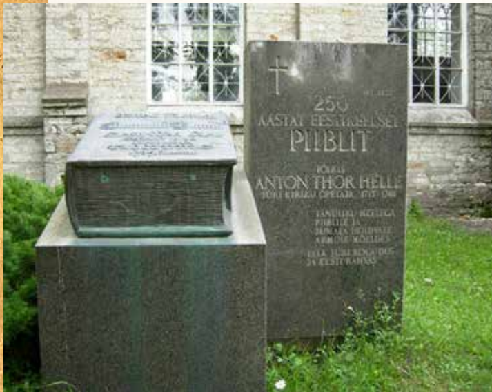
Памятник Библии в поселке Бри, Харьюмаа (Эстония).

Примечательно, что Библия возникла не в центрах науки и культуры — Александрии (Египет) или в Афинах (Греция), и ее авторы часто были совсем простыми людьми. Они не были великими учеными, да и порой они владели лишь разговорной речью, и все же Библия стала собранием литературных произведений, и это не только для евреев и говоривших на древнегреческом языке первых христиан, а для всех народов и племен. Библия стала всемирным достоянием и признана крупнейшим литературным и историческим памятником всех времен и народов.