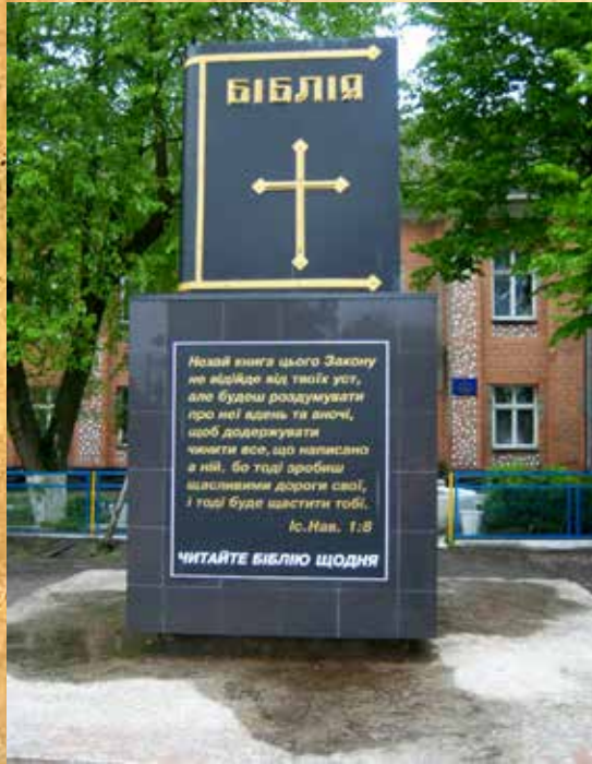
Памятник Библии в селе Дераяня, Ровненская область (Украина)