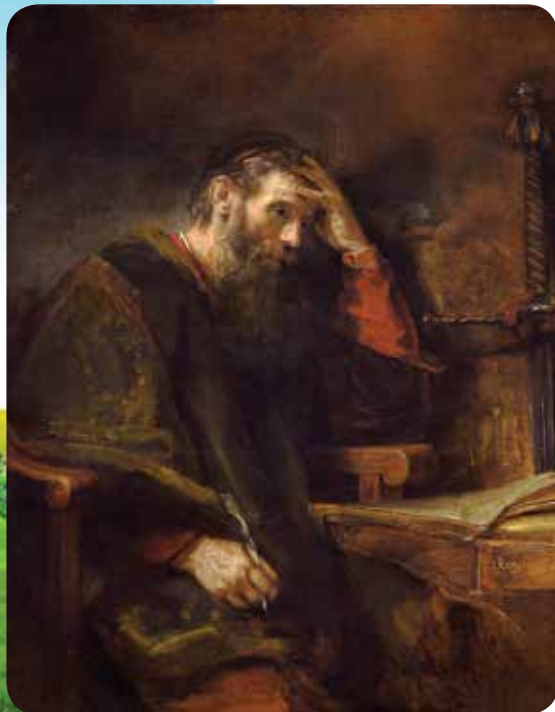
Рембрандт (1606—1669) (и мастерская) «Апостол Павел»

Так должно быть всегда. Ничто не является таким недостойным христианина, как дух раздражения, угрюмый или унылый нрав, сердитое, мрачное лицо.