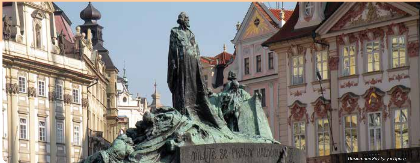
Памятник Яну Гусу в Праге

«И все, что делаете, делайте от души, как для Господа, а не для человека. Зная, что в воздаяние от Господа получите наследие; ибо вы служите Господу Христу» (Кол. 3:23-24)