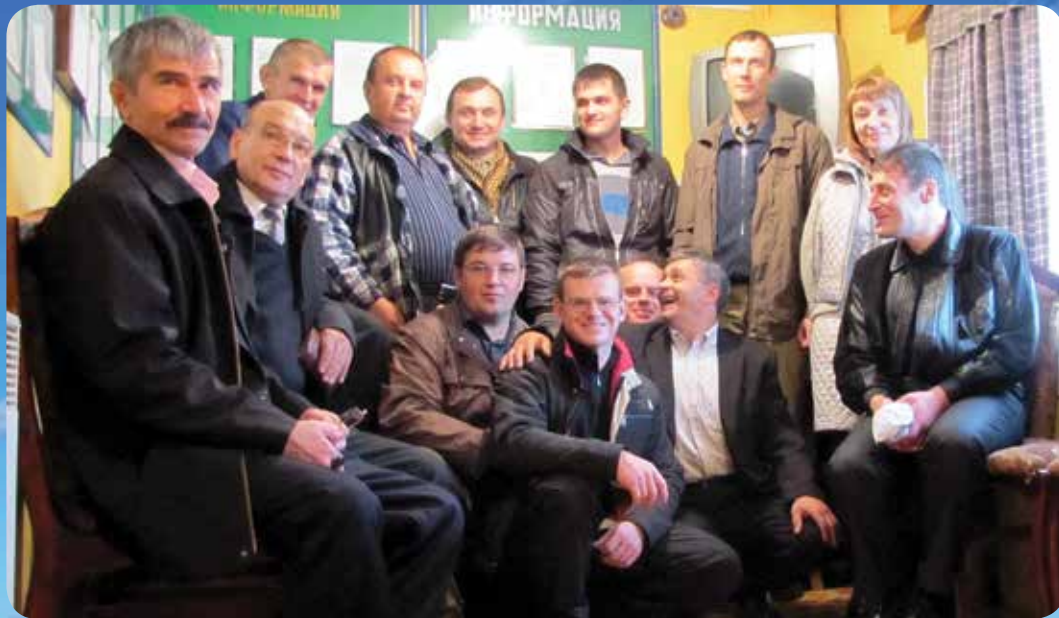
Команда тюремных служащих в поселке Сосновка, Мордовия

Харпе и Соликамске ведем переписку, места не хватит всех перечислить, — каждому самые горячие христианские пожелания! Всех помню и всем пишу ответы. Не брошу вас. А особенно вас прошу не забывать, что если вы с Богом, то вы свободны! «...где Дух Господень, там свобода» (2 Кор. 3:17)! Ваши молитвы и мысли никто не может закрыть и ограничить. Бог — это Дух, Он везде, так и вы Духом Его можете быть не связаны ничем, быть свободными от греха и нечистых мыслей, а Бог укрепляет всегда, поддерживает и оживляет. А если вы вдвоем в камере верующие, то это уже собрание! Что мешает вам вместе молиться? Поддерживать друг друга духовно? Ведь у вас одинаковые условия пребывания, одни и те же трудности и сложности, да и жизнь складывается вместе... Вы в одних стенах и условиях, немножко любви друг к другу и все станет по-иному, проще и легче.