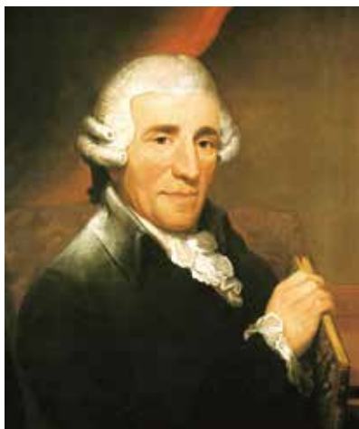
Йозеф Гайдн (1732 – 1809 гг.), портрет работы Томаса Харди, 1792

Гайдн — великий австрийский композитор. Его справедливо считают отцом симфонии и квартета, основателем классической инструментальной музыки, родоначальником современного оркестра. Все признают огромное мастерство Гайдна, поразительные стройность, соразмерность, четкость и уравновешенность его музыки. Но немногие знают, что Йозеф Гайдн был глубоко верующим человеком, посвященным не только музыке, но и Богу. Об этом говорят и его слова, и чарующая музыка, прославляющая Творца. Композитор был убежден, что всякий талант исходит от Бога. Йозеф говорил: «Каждый день я склонялся молиться Богу и просил Его дать мне силы для моей работы. Я тихо и уверенно молился Богу, чтобы он даровал мне талант, необходимый для достойного прославления Его».