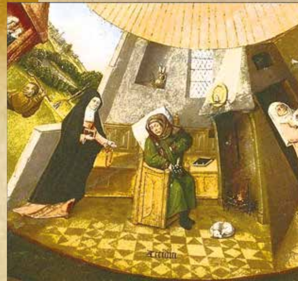
Иероним Босх «Уныние» (фрагмент «Семь смертных грехов», 1475 – 80 гг.)

Тот, Кто берет на Себя грех мира, должен нести на Себе и необъятность людской печали и не быть ею раздавленным. Подобно пророкам, Иисус Христос скорбел об ожесточении фарисеев (Мк. 3:5), плакал над бесчувствием Иерусалима, не узнавшего часа своего посещения (Лк. 19:41). Иисус печалился не только о судьбе избранного народа, Он прослезился, когда смерть настигла Его друга Лазаря (Ин. 11:35). Иисус восскорбел внутренне (Ин. 11:38): Он любил Лазаря любовью, которая от Отца (Ин. 15:9).