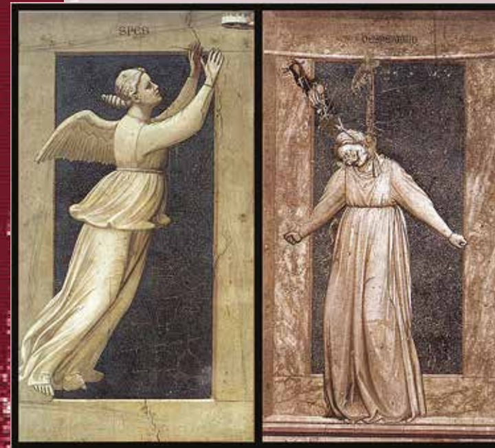
Джотто ди Бондоне «Надежда-Уныние» (фрески капеллы дель Арена в Падуе, Италия), 1306 г.