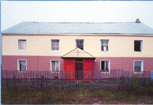
Наш Христианский центр