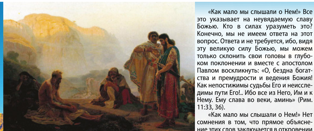
Илья Репин «Иов и его друзья», 1869 год

В середине своей речи Иов делает полный поворот от положительного к отрицательному. Но часто отрицательное может лучше обрисовать какую-нибудь истину, чем положительное. Иов свидетельствует, что даже сказав все о величии Божьем в природе, мы видим лишь слабые штрихи Его бесконечной и безграничной силы: «Вот, это части путей Его; и как мало мы слышали о Нем! А гром могущества Его кто может уразуметь?» (Иов 26:14).