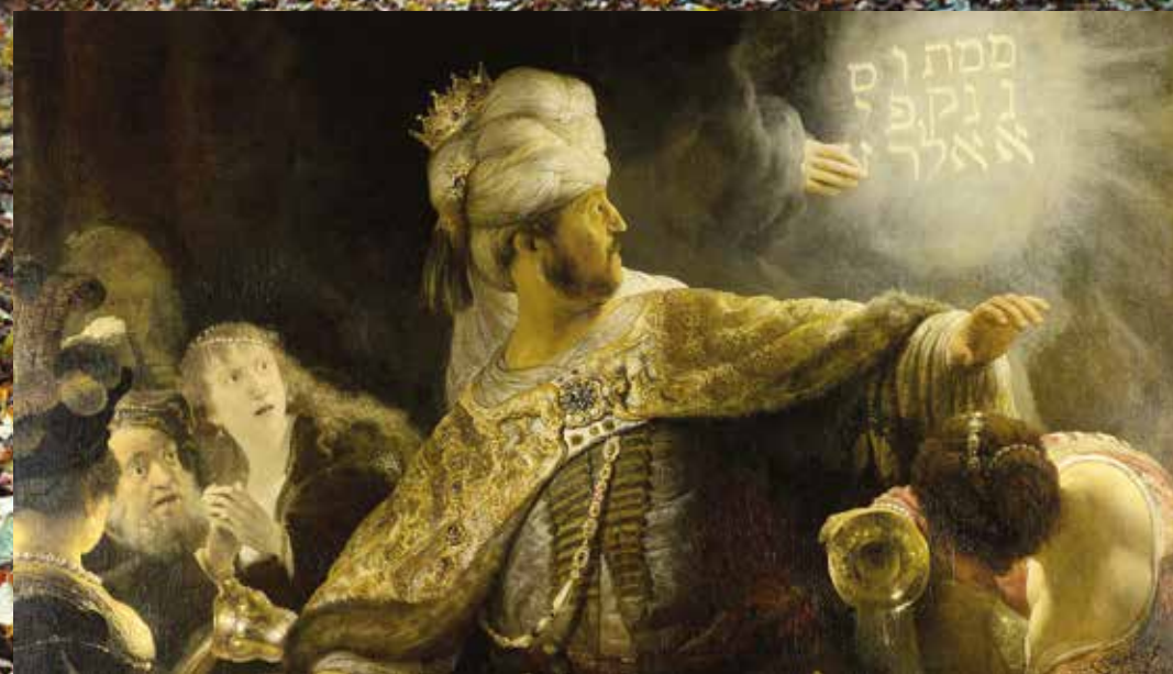
«Пур Валтасара: Мене, мене, текел, упарсин» Рембрандт

«Дней лет наших — семьдесят лет, а при большей крепости — восемьдесят лет; и самая лучшая пора их — труд и болезнь, ибо проходят быстро, и мы летим». Вызывает споры о мнениях то, что лучшая пора жизни — труд и болезнь... Но Слово Божье говорит, что «...страдающий