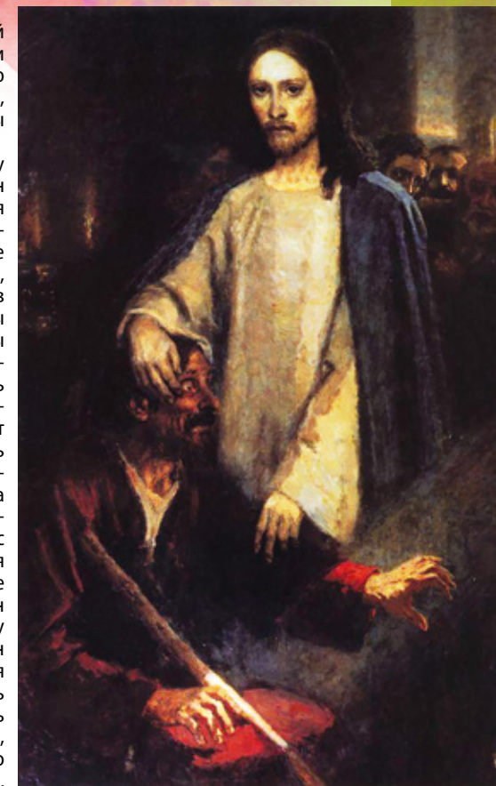
«Исцеление слепорожденного Иисусом Христом», 1888 год.

Через полтора года после смерти жены на мольберте Василия Сурикова появилась новая картина — «Исцеление слепорожденного Иисусом Христом». «Мама и брат были счастливы, — пишет историк. — Как непохожа была эта работа на тот страшный автопортрет с отсутствующим взглядом, который он написал год назад. Понравилась и безыскусная простота работы, и лицо Христа — оно вселяло уверенность в силу жизни, побеждающую все». Один из первых зрителей заметил, что слепой похож на автора картины. Со слезами на глазах Василий Иванович признался, что писал картину для самого себя, по душевной потребности, чтобы облегчить свою боль. Но произошло нечто большее, почти чудо: «Это меня самого Христос исцелил от слепоты!»