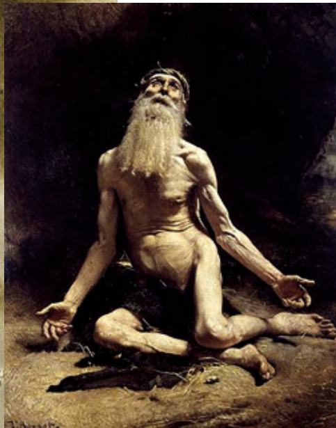
«Иов», Леон Бонна, 1880 г.

История Иова учит прощать. Душевная боль Иова была многократно усилена его друзьями, которые высказали много несправедливых суждений. «А вы сплетчики лжи; все вы бесполезные врачи. О, если бы вы только молчали! это было бы вменено вам в мудрость» (Иов. 13:4-5). И вот, когда наступила развязка, Бог проговорил к одному из друзей Иова: «...горит гнев Мой на тебя и на двух друзей твоих за то, что вы говорили о Мне не так верно, как раб Мой Иов» (Иов 42:7). Бог повелевает им опять идти к Иову и просить его, чтобы он за них помолился. Возможно, Иову было нелегко молиться за своих друзей и просить Бога, чтобы Он отвратил от них Свой гнев. Чисто по-человечески Иов мог бы сказать, что он испытал на себе руку Господню, а теперь, мои друзья, ваша очередь испытать на себе Его гнев, дабы впредь думали, прежде чем говорить. Но Иов помолился за них, и Бог отвратил Свой гнев от этих людей, а главное — Бог полностью восстановил Иова именно после этой молитвы: «И возвратил Господь потерю Иова, когда он помолился за друзей своих; и дал Господь Иову вдвое больше того, что он имел прежде» (Иов 42:10).