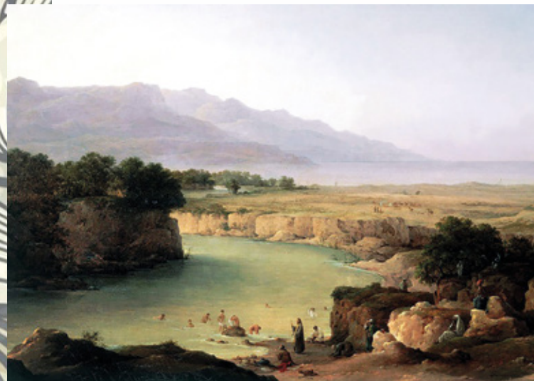
«Вид реки Иордан при впадении в Мертвое море». Н.Г. Черенцов, 1854 г.

Прибыв в страну Израильскую, Нееман направляется прямым путем к царю. Здесь он торжественно передает письмо. Оно гласило: «...вместе с письмом сам я посылаю к тебе Неемана, слугу моего, чтобы ты снял с него проказу его» (4 Цар. 5:6). Это короткое и решительное, как ультиматум, требование невыполнимо даже для царя. Письмо действует как громовой удар.