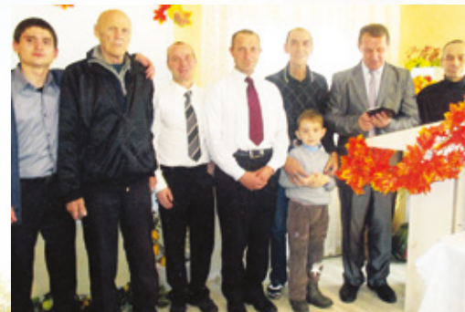
На празднике жатвы в церкви г. Вильгорт, Коми