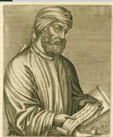
Квинт Септимий Флорент Тертуллиан (ок. 155 – ок. 220) — раннехристианский богослов, писатель, апологет.

Идолопоклонство — главное преступление рода человеческого, наивысшее прегрешение мира, единственная причина Страшного Суда. Ибо всякое иное преступление может быть отнесено к особой разновидности и подлежит суду под своим именем, в случае же идолопоклонства совершаются все преступления одновременно. Отбрось же определения, смотри прямо в суть деяния! Идолопоклонник— тот же убийца. «Кого убил он?»— спросишь ты. Суть преступления, в котором мы его обвиняем, в том, что он убивает не постороннего, не противника, а самого себя. Из какой засады? Из засады своего заблуждения. Каким оружием? Оскорблением Бога. Сколькими ударами? Столькими, сколько раз совершается идолопоклонство. Тот, кто отрицает, что служащий идолам — убийца, отрицает и то, что он осужден на гибель. В служащем идолам следует признать также прелюбодеем и развратника. Ибо тот, кто служит ложным богам, несомненно является прелюбодеем в отношении истины, ибо всякая ложь есть прелюбодеевание. Так же точно он погружен в разврат. Действительно, разве тот, кто призывает себе на помощь нечистых духов, не оказывается вместе с ними повинным в мерзости и разврате? Ведь и Священное Писание употребляет именно слово «разврат», когда порицает идолопоклонство.