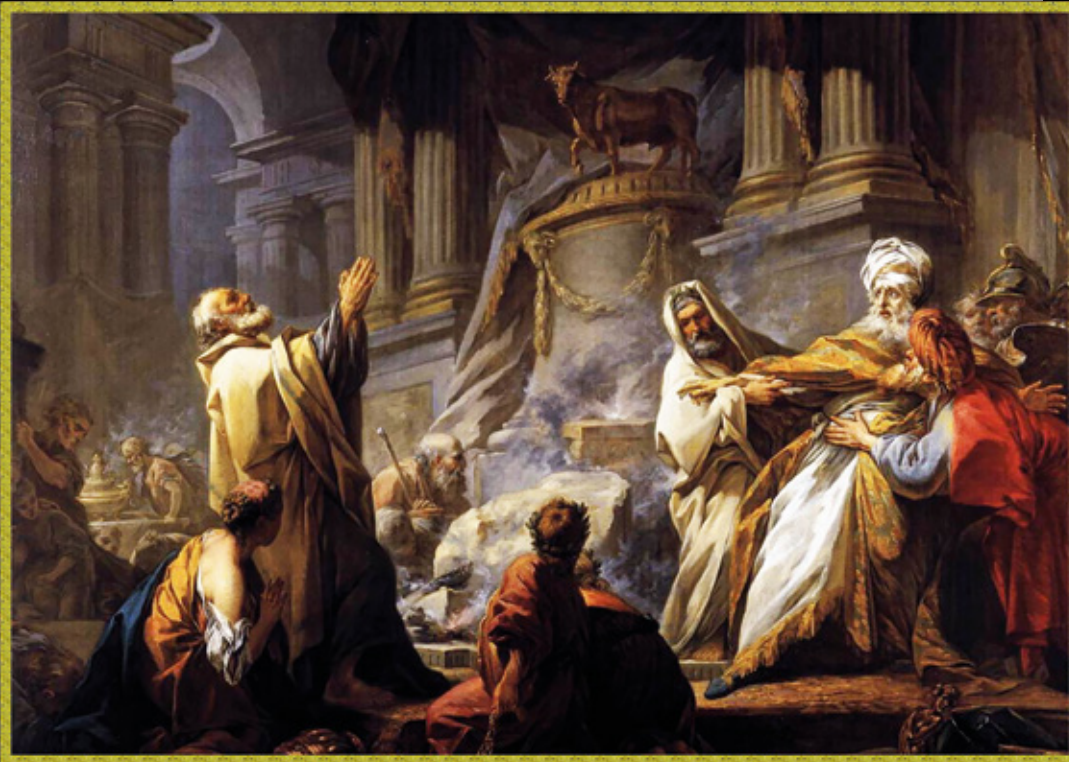
«Иеровоам приносит жертву идолам», Жан Оноре Фрагонар, 1752 г.

Бог говорит во второй заповеди: «не поклоняйся им и не служи им, ибо Я Господь». Люди поклоняются созвездиям, под которыми якобы родились и которые якобы ведут их судьбу. Люди поклоняются различным драконам и змеям, козлам и крысам, которые якобы влияют на их характер. Бог запрещает делать все это. А человек, находясь в зависимости от привычных традиций и кумиров, таким образом отвергает волю Бога. Но каждый из нас вправе сделать свой выбор. И выбор этот очень прост и одновременно чрезвычайно сложен. Оставаясь в привычном состоянии со своими кумирами, живя как все, ты остаешься рабом, безвольным, бесправным, заложником человеческих традиций. И твоя жизнь ограничена оградой кладбища. Если же ты дерзнешь вырваться из круга привычных вещей, отбросить своих кумиров и идолов, ты окажешься один на один перед Богом, Которому ты будешь должен отдать свою жизнь. И с этого момента над тобой более не будет власти человеческой. Ты станешь свободен. Ты обретешь вечную жизнь, ибо вечный Бог станет твоим Богом.