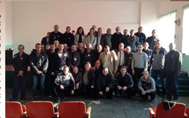
Служение в Пятихатской ИК-122

Пришел день нашей встречи. Я сидела на последней лавочке и ничего не могла понять из того, что слышала с кафедры, но внутри была уверена, что говорят правильно. Я ждала одного, когда скажут, кто хочет обратиться к Богу? В конце