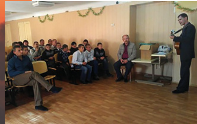
Общение с несовершеннолетними в п. Балаховка Кировоградской области