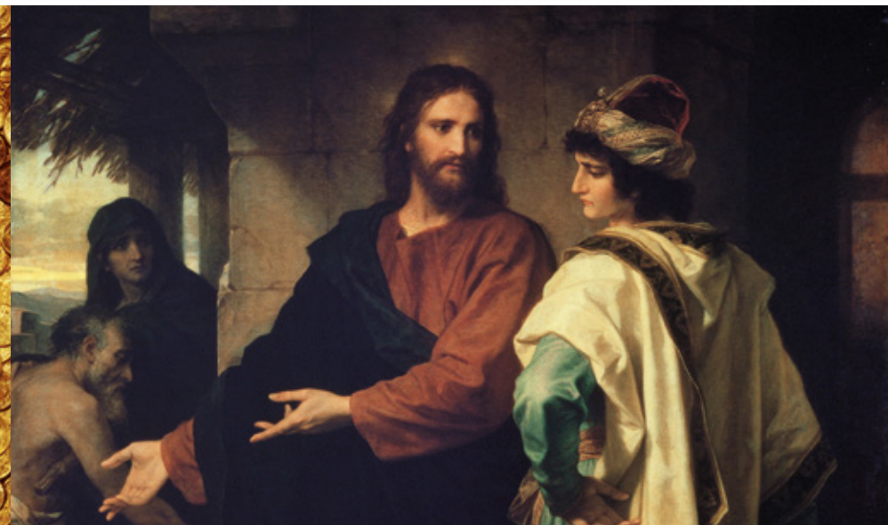
Генрих Гоффман. Христос и богатый юноша, 1889 г. Фрагмент

Кто-нибудь возразит: разве это не самомнение или хвастливость при всех людях заявить, что со дней юности он соблюдал заповеди, которые перечислил Иисус? В том, что юноша сказал правду, нет никакого сомнения. В противном случае Христос, отлично знающий всех людей, упрекнул бы его в неискренности. Но Христос, напротив, полюбил его.