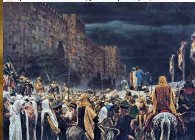
Василий Верещагин «Распятие на кресте», 1887 г.

У нас у всех много переживаний, скорбей, страданий души и тела. Наши близкие могут не знать об этом. Но вот вопрос: в чем причина постигших нас страданий? К сожалению, мы вынуждены сказать вместе с благодушным разбойником: мы достойное по делам нашим получаем. Но если кто страдает ради Христа, тот блажен. Принесем же наши истерзанные сердца к подножию креста, и Господь окажет Свою помощь и даст Свой божественный мир.