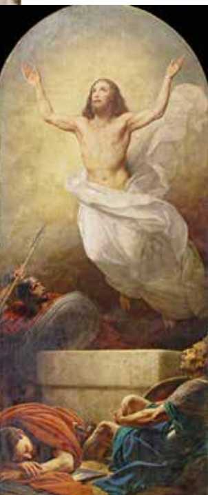
Карл Штейбен, «Воскресение Христа», 1843 — 1845 гг. (Исаакиевский собор, Санкт-Петербург)