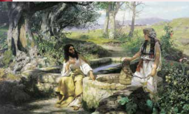
Генрих Семирадский «Христос и самарянка», 1890 г.

Встреча Иисуса с самарянкой описана в Евангелии от Иоанна (4:1-42). «Надлежало Ему проходить через Самарию...» Дорога через Самарию была самым коротким путем между Галилеей и Иерусалимом. Однако большинство евреев обычно ходили более длинным путем, чтобы избежать контакта с самарянами. Самаряне были потомками от смешанных браков евреев с язычниками, они остались здесь после того, как Северное царство было завоевано Ассирией, а его население увели в плен (4 Цар. 17:24). Позднее, в 4-й главе книги Ездры и в 4-й главе книги Неемии, мы читаем о глубоком разделении между евреями и самарянами,