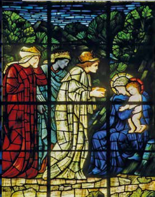
Эдвард Бёрн-Джонс (Edward Burne-Jones) "Рождество"