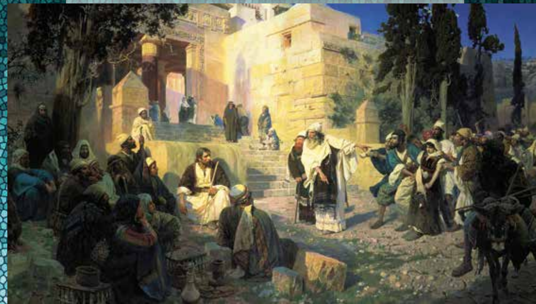
«Христос и грешница (Кто из вас без греха?)» Василий Polenov, 1886 – 1887 гг., Государственный Русский музей, Санкт-Петербург

Но Христос дальше приводит удостоверение Своей божественности: «Ибо, как Отец воскрешает мертвых и оживляет, так и Сын оживляет, кого хочет» (Ин. 5:21). Эти слова говорят о непосредственном контакте Иисуса Христа с Богом Отцом в отношении жизни. Он носит ее в Себе, как и Отец. Христос является источником жизни; Он дает жизнь так же, как и Отец; грешников Он воскрешает из мертвых к новой жизни не только телесно, но и духовно. Эти слова Спасителя означают, что Он Тот, Который не имеет ни начала дней, ни конца жизни. И на