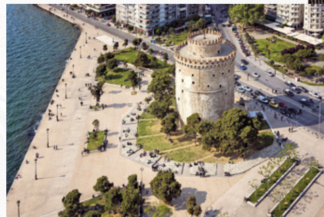
Белая башня, г. Салоники (Фессалоники), Греция.