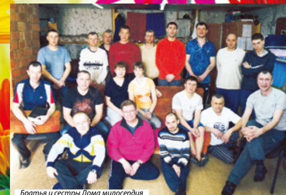
Братья и сестры Дома милосердия