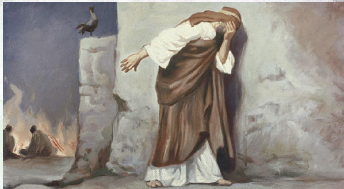
Антон Роберт Лейнвебер. Отречение Петра.

Это голос лукавого, который день и ночь клеветает на детей Божьих. Он всегда сеет страх, что Бог не простит и что ты недостойн Его милости. И если есть что-либо хуже, чем само согрешение, то это страх, которым сопровождается падение. Почему? Потому что страх препятствует человеку прийти к Богу. Когда Адам согрешил, то, исполнившись страха, скрылся между деревьями рая. Когда Петр отрекся от Христа, то, боясь встречи с Ним, удалился. Иона тоже бежал от Бога. Все они скрывались от лица Божьего не потому, что они не любили Бога, но потому, что они боялись, что Бог на них разгневается и их не примет. Сатана, который привел их к падению, внушает этот страх. Он говорит, что Бог слишком свят, а ты слишком грешен, и