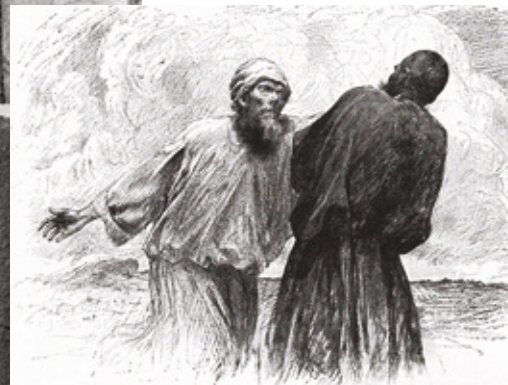
Жен Бернад. Притча о немилосердном должнике.

Нужно сказать, что прощать нелегко. Многие говорят, что не могут простить брату своему несправедливую обиду. Но тем не менее прощать необходимо, потому что иначе Господь не простит нам согрешений наших. Мы должны страшиться потерять дух прощения. Поспешим же скорее к Господу и попросим, чтобы Он, милосердный Господь, дал силы неустанно прощать нашим ближним. Многие из нас устали прощать, но, несмотря на это, необходимо продолжать прощать, ибо прощение есть основной принцип практического христианства.