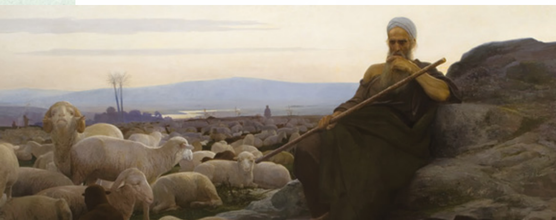
Исаак Львович Аскназий. Моисей в пустыне.

Робость, малодушие, страх — это результат неуверенности в прощении грехов. Вы сразу можете узнать прощенного человека — он радостен, смел, бодр. Верь, что Бог прощает, верь, что Он тебя простил, и ты будешь смел, как лев. Таких Бог использует. Да, они знают свое бессилие, они сознают свою нищету, но в то же время они знают своего Бога. Уверенность в любви Божьей, в том, что Он тебя простил, дает смелость также в молитве. Молитва больше не будет тяжестью, но временем наслаждения. Ты не будешь ее избегать, но будешь искать всякую возможность уединиться со своим Богом. У тебя будет вера просить о многом и о великом. Ты не будешь малодушествовать пред Богом, но будешь смел в своих просьбах.