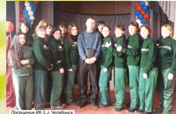
Посещение ИК-5, г. Челябинск