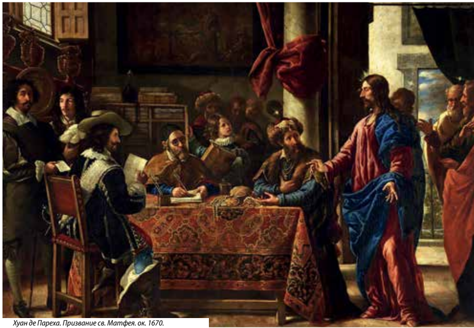
Хуан де Пареха. Призвание св. Матфея. ок. 1670.

и достижения им милее, чем Его подвиг. Даже религиозные люди совершают ту же ошибку, когда хвалятся давностью происхождения своего исповедания, его богатой историей, вкладом в прогресс человечества, именами знаменитых приверженцев, роскошью украшений, административной или военной мощью. Однако эта похвальба неуместна, ибо не имеет никакого основания в Евангелии. Хвалиться нужно другим — делом Христа.