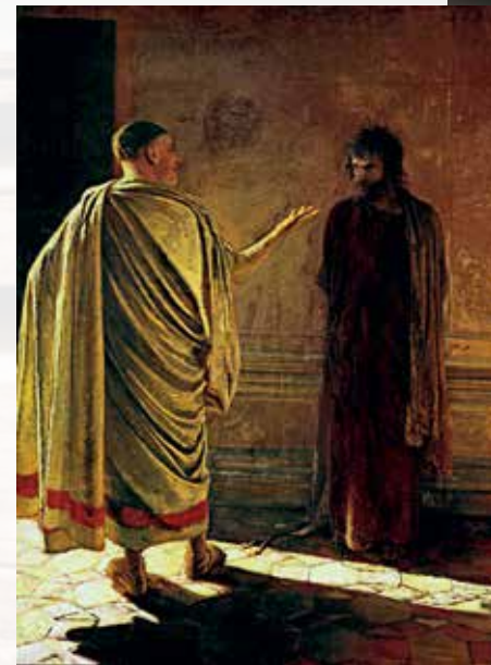
Николай Ге. «Что есть истина?» Христос и Пилат. 1890.

В буддизме, например, высшая цель — достичь нирваны или исчезновения всяких желаний. В индуизме конечная цель также нирвана, но здесь это окончательное слияние с богом индуизма. Это состояние сравнивается с возвращением капли воды в океан. В исламе