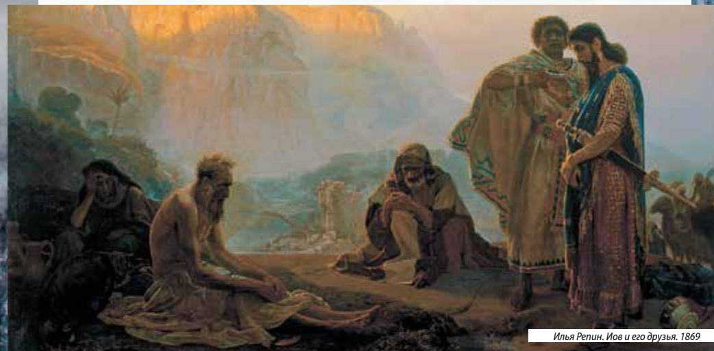
Илья Репин. Иов и его друзья. 1869

Мой друг, и ты можешь благодарить Господа за то, что на многие твои молитвы Господь не ответил, по крайней мере так, как ты этого хотел. «Всякую у Меня ветвь не приносящую плода, — говорит Иисус Христос, — Он [Отец Мой] отсекает; и всякую, приносящую плод, очищает, чтобы