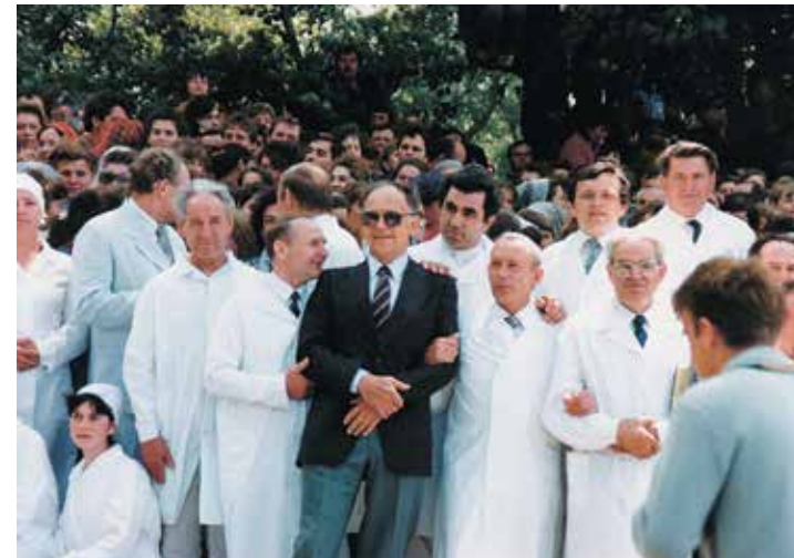
1988 год. Киев. Празднование тысячелетия крещения Руси