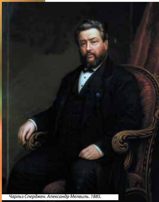
Чарльз Сперджен. Александр Мелвилль. 1885.

«Дух дышит, где хочет, и голос его слышишь, а не знаешь, откуда приходит и куда уходит: так бывает со всяким, рожденным от Духа» (Ин. 3:8)