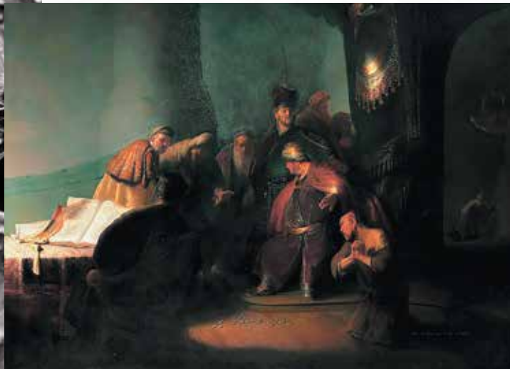
Рембрандт Харменс ван Рейн. Раскаившийся Иуда возвращает сребреники. 1629

Как понимать все эти предсказания и намеки? Не был ли Иуда лишь пассивным исполнителем воли Божьей? Попытки представить Иуду орудием Промысла Божьего предпринимались уже в древности. Однако Евангелия однозначно осуждают поступок Иуды и не оставляют места для его оправдания. Во всех четырех Евангелиях Иуда предстает исключительно как отрицательный персонаж, к которому евангелисты не питают ни симпатии, ни сочувствия.