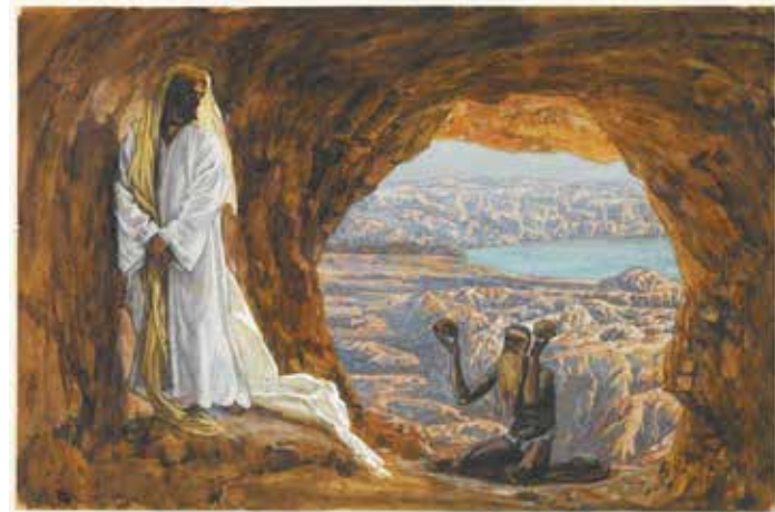
Джеймс Тиссо . Испытание Иисуса в пустыне. Бруклинский музей

О если бы люди чаще задавали себе вопрос: нужна ли мне такая власть, дает ли мне ее Бог или я сам захватил ее? А может быть, меня использует нечистая сила?