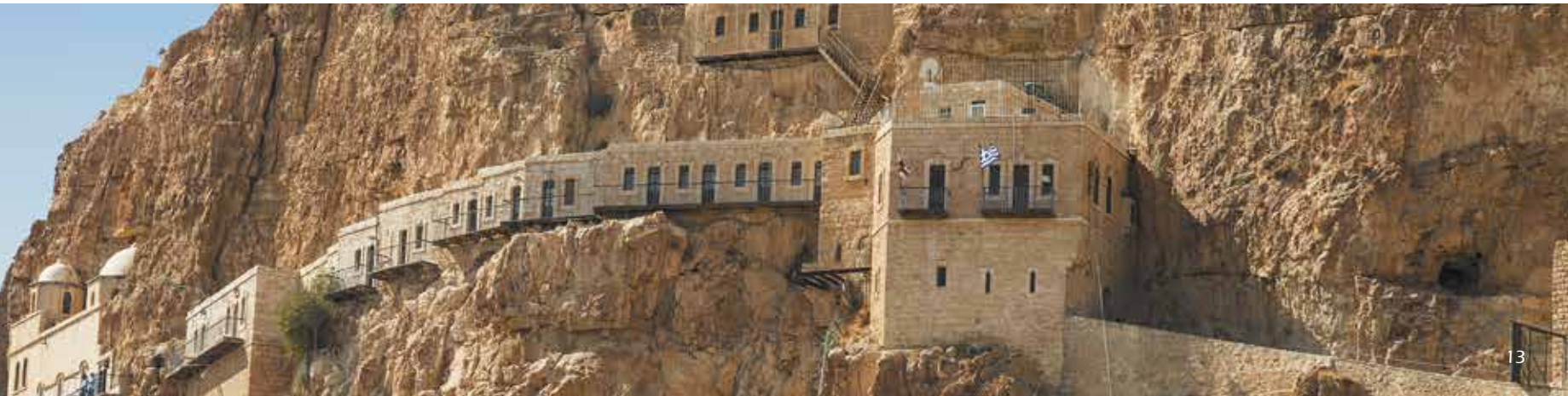
Монастырь на горе Каранталь. Израиль

Гора Каранталь находится в окрестностях Иерихона и имеет высоту 380 м. Церковное предание считает ее местом, где Иисус был искушаем дьяволом. На ее вершине располагается монастырь Искушения, основанный в IV веке, — православный мужской монастырь, где единственным насельником в настоящее время является греческий монах. Название Каранталь унаследовано от крестоносцев и означает «сорок». Именно столько дней провел в пустыне Иисус. Все внутренние помещения монастыря вырублены в скале, а в пещере устроена небольшая часовня. На гору ведет канатная дорога, ее протяженность 1330 м.