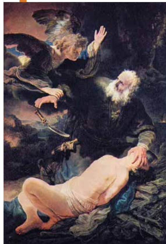
Рембрандт Харменс ван Рейн. Жертвоприношение Исаака. 1635