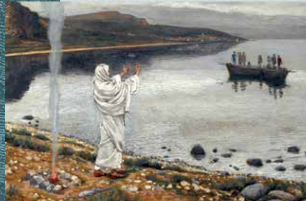
Джеймс Тиссо. Явление Христа на берегу Тивериадского озера.