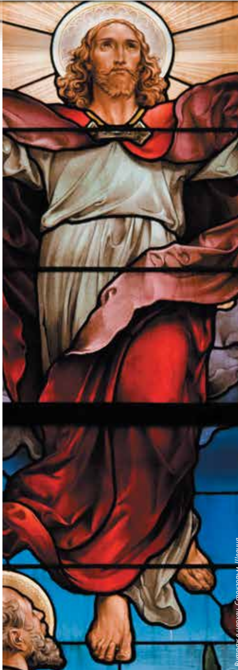
Витраж в церкви, Стокгольм, Швеция

Каждый великий мудрец сознавал свое неведение. Сократ говорил: «Я знаю, что я ничего не знаю». Величайшие мыслители всех времен и народов ощущали