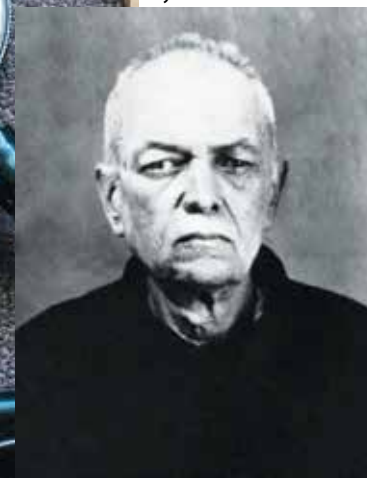
Ташкент, тюрьма НКВД, 1939 год.