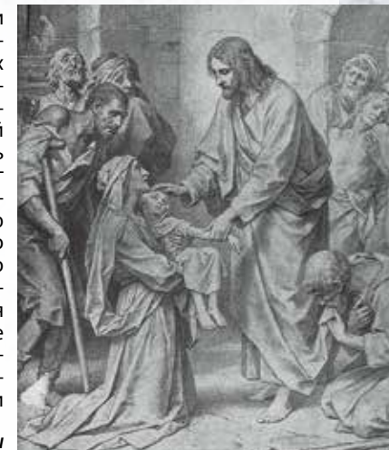
«Великий Врач за работой», Ф. Хоффманн, 1890.