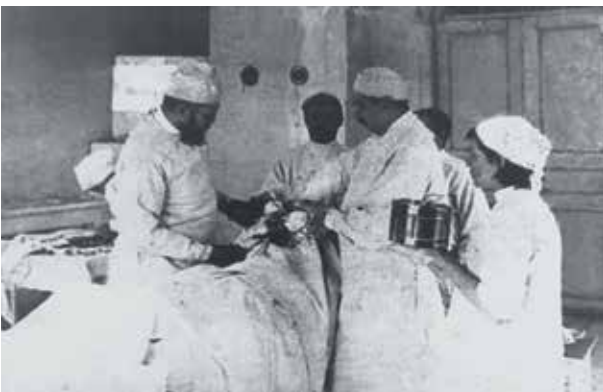
Хирург В. Ф. Войно-Ясенецкий (слева) проводит операцию в земской больнице.

жизни! Редкостным было и отношение доктора к больным. «Приступая к операции, — учил он будущих хирургов, — надо иметь в виду не только брюшную полость и тот интерес, который она может представлять, а всего больного человека, который, к сожалению, так часто у врачей именуется «слушаем». Человек в смертельной тоске и страхе, сердце у него трепещет не только в прямом, но и в переносном смысле. Поэтому не только выполните важную задачу подкрепить сердце камфарой, но позаботьтесь о том, чтобы избавить его от тяжелой психической травмы: вида операционного стола, разложенных инструментов, людей в белых халатах, масках — усыпите его вне операционной. Позаботьтесь о согревании его во время операции, ибо это чрезвычайно важно».