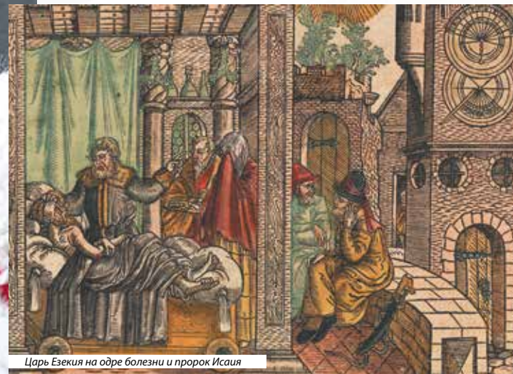
Царь Езекия на одре болезни и пророк Исаия

Вот уже больше года мы живем в условиях борьбы с коронавирусной инфекцией, от которой пострадали порядка 150 млн жителей планеты. Три миллиона из них умерли... Многие прошли через страдания от этой болезни, а кому-то еще предстоит их испытать. Но не будем смущаться! Это часть путей Божьих. Он сказал, что будут глады и моры, однако и волос с вашей головы не падет на землю без воли Отца Небесного. Тем более не поднимется температура, не одолеет кашель, тело не подкосит слабость.