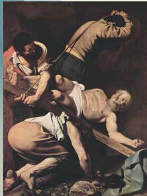
Караваджо. Распятие святого Петра. 1601.

Христос призывает Петра на великое служение. Призыв Христа к служению Петр слышал неоднократно. Еще в самом начале следования за Христом, после чудесного улова, Петр услышал из уст Христа слова: «...отныне будешь ловить человеков» (Лк. 5:10). Затем перед Своей молит-