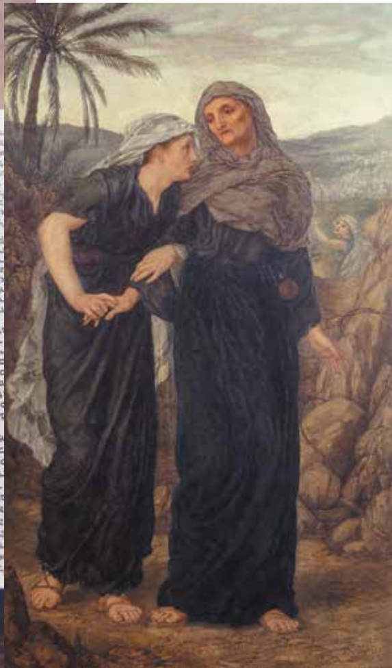
Томас Мэттью Рук. Ноемиль и Руфь. 1876.

(перевод Игоря Белослудцева 618545 Пермский край, г. Соликамск, ул. Карналлитовая, д. 98, ИК-2, ОУХД, ПЛС).