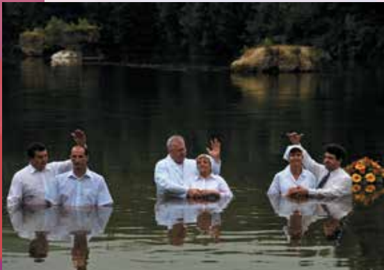
2009 год. Крещение