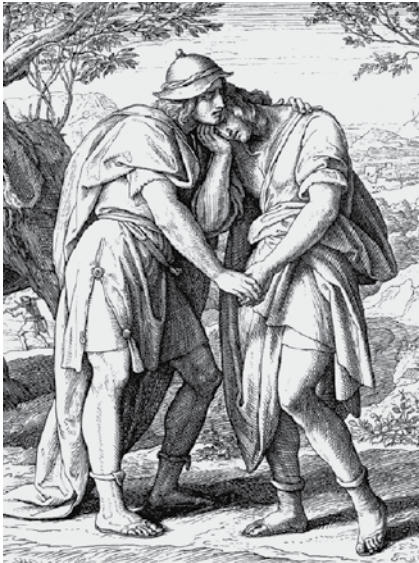
Юлиус Шнорр фон Карольсфельд. Давид и Ионафан.

Когда человек приходит ко Христу, он начинает переосмысливать свои взгляды на все аспекты человеческой жизни. И сегодня мы поговорим о такой важной части человеческой жизни, как дружба. Какой должна быть христианская дружба? Что об этом сказано в Библии?