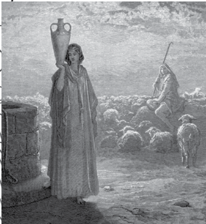
Гюстав Доре. Иаков пасет стада Лавана. 1866 г.

«У Лавана же было две дочери; имя старшей: Лия; имя младшей: Рахиль. Лия была слаба глазами, а Рахиль была красива станом и красива лицом. Иаков любил Рахиль...» (Быт. 29:16-18). Вы когда-нибудь попадали в ситуацию, в которой становились невинной жертвой обстоятельств? Вы не стремились к этому, и это не ваша вина, но так случилось. Лия — женщина, которая оказалась именно в такой ситуации. А пример жизни Лии — это пример правильных поступков, даже когда с тобой поступают неправильно. Это пример верной жены, несмотря на неблагоприятные обстоятельства в ее семье.