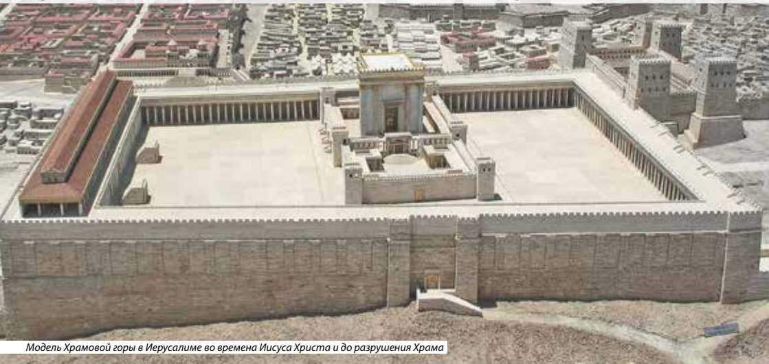
Модель Храмовой горы в Иерусалиме во времена Иисуса Христа и до разрушения Храма