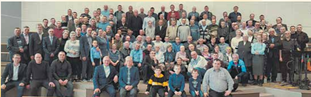
СЛУЖЕНИЕ БРАТСКИХ И СЕСТРИНСКИХ ДОМОВ